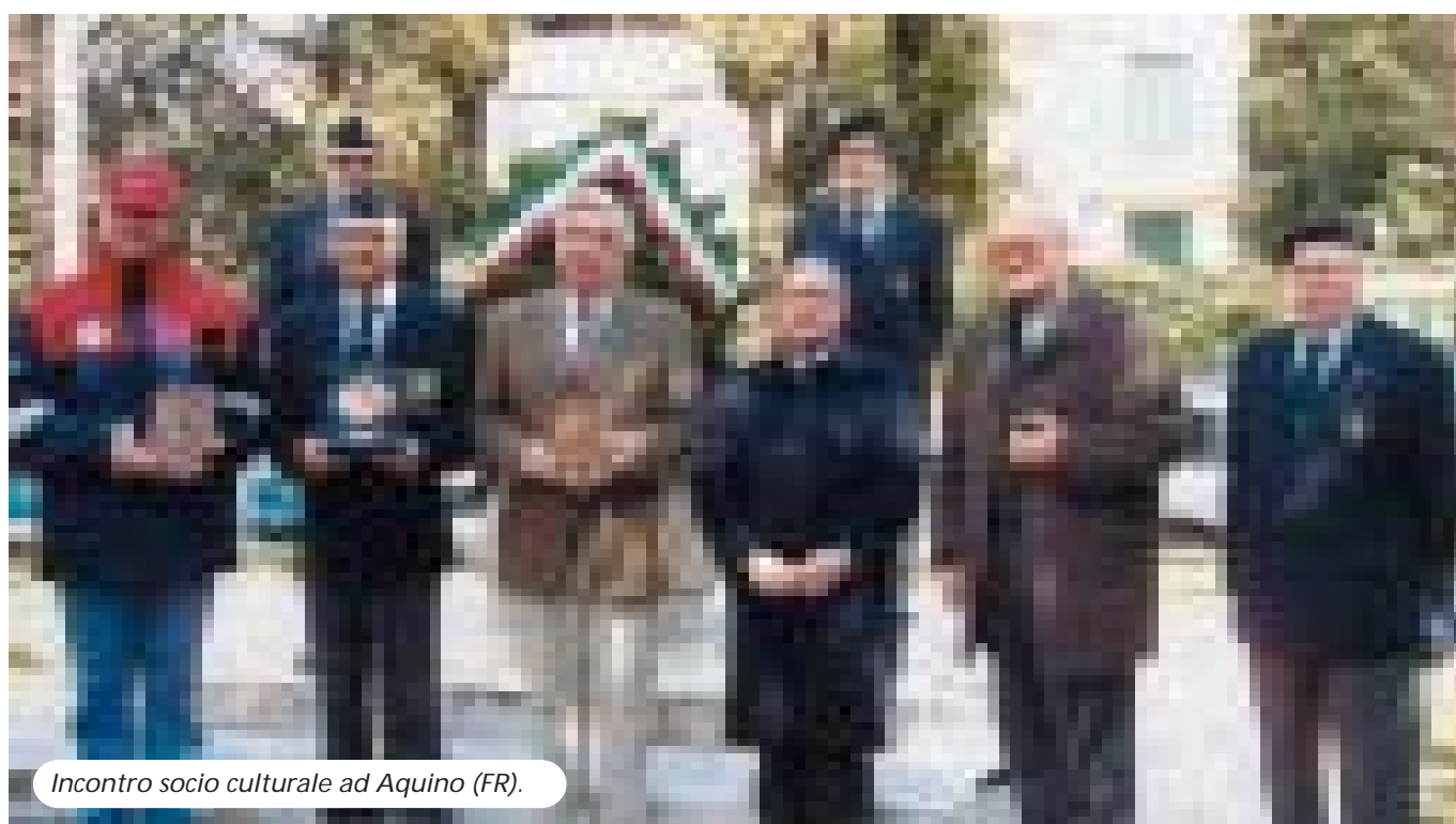
Incontro socio culturale ad Aquino (FR).