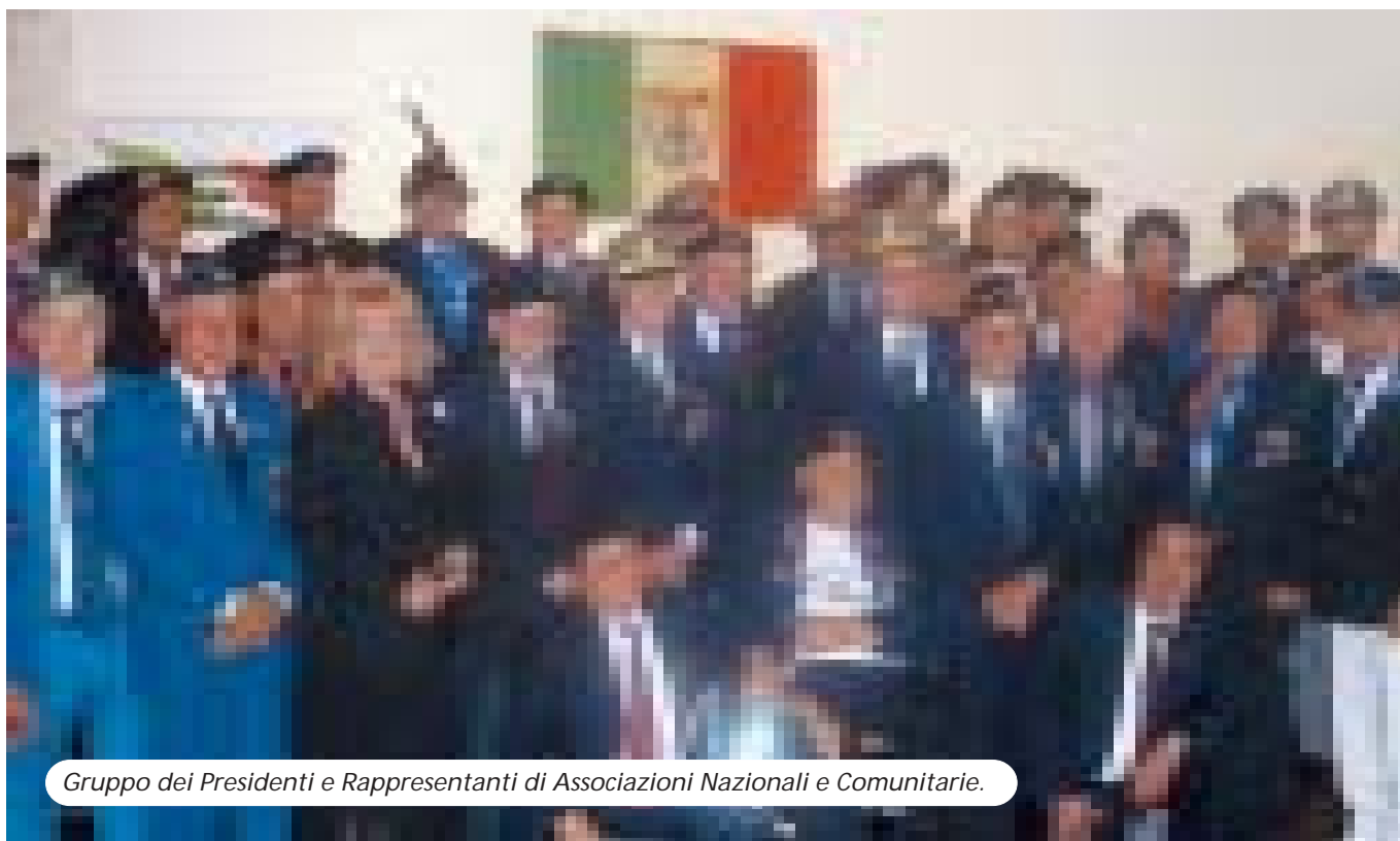
Gruppo dei Presidenti e Rappresentanti di Associazioni Nazionali e Comunitarie.

In terra Australiana, con la partecipazione di numerosi rappresentanti di Associazioni Combattentistiche d'Arma e di club sociali, è stato ricordato il 21° anniversario dell'UNSI Unione Nazionale Sottufficiali.