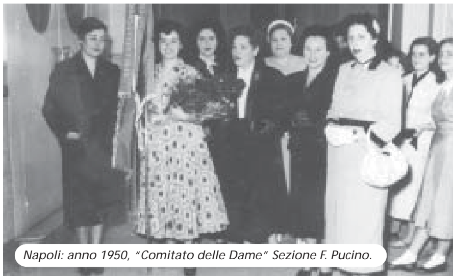
Napoli: anno 1950, “Comitato delle Dame” Sezione F. Pucino.

Il Consiglio Direttivo della Sezione “F. Pucino” di Napoli, su richiesta del “Comitato delle Dame” ha deliberato di attivare le procedure per una “Adozione” a distanza di un bambino/a della durata di cinque anni, come previsto dalle disposizioni indicate dalla trasmissione televisiva “Amore” in onda sulla Rete Nazionale “RAI”.