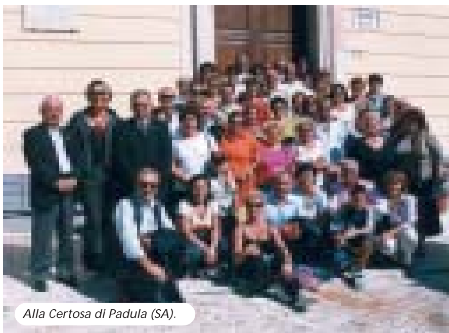
Alla Certosa di Padula (SA).