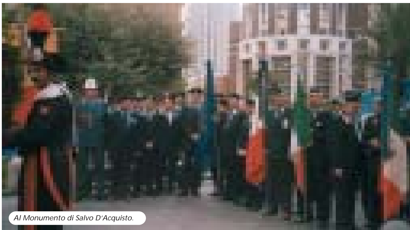
Al Monumento di Salvo D'Acquisto.