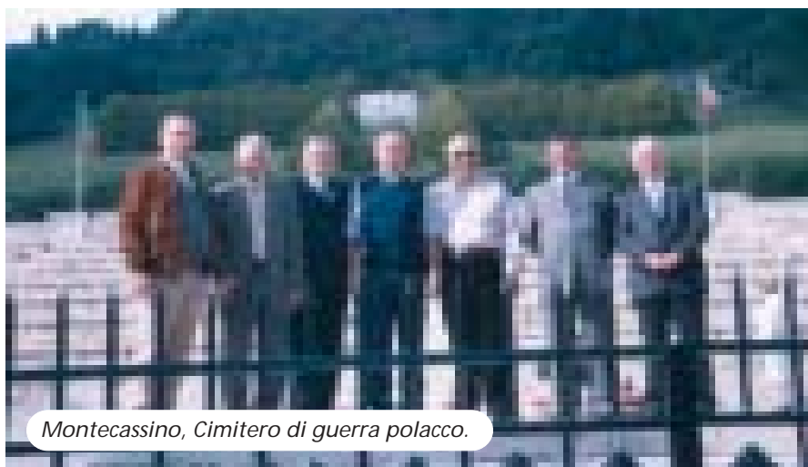
Montecassino, Cimitero di guerra polacco.